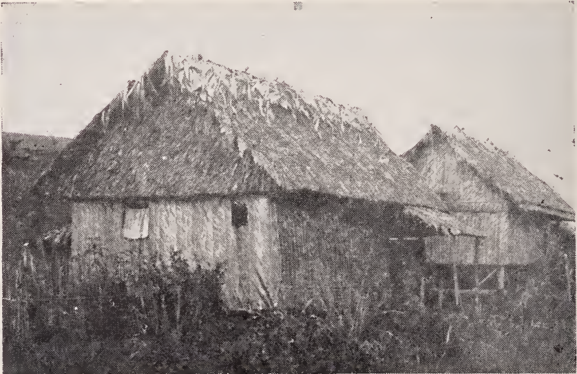
Auténticos ranchos de los indios guaraúnos en las Bocas del Orinoco.